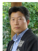
重森三明