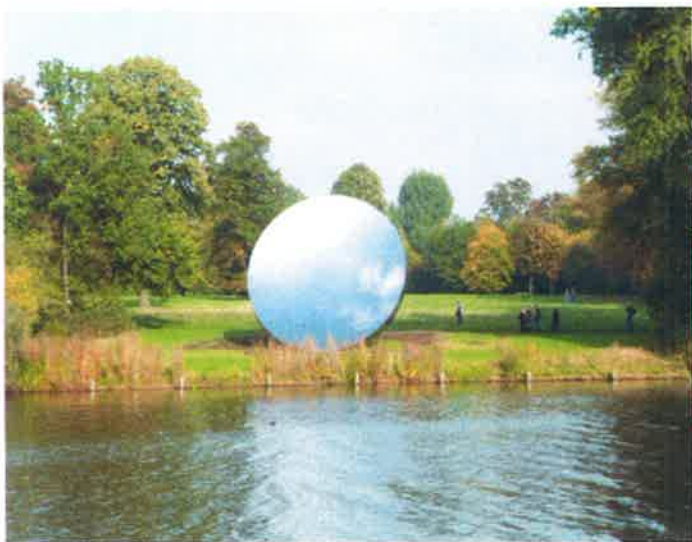
Sky Mirror, 2006 Stainless steel Diameter 10 m